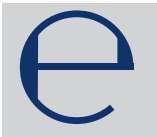
e-Zeichen auf Fertigpackungen

Der Grundpreis (Preis je Mengeneinheit, z.B. 20,95 €/kg) ist in unmittelbarer Nähe des Endpreises anzugeben. Die Angabe des Grundpreises ist auch in der Werbung erforderlich. 3)